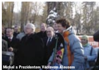
Michal s Prezidentem Václavem Klausem