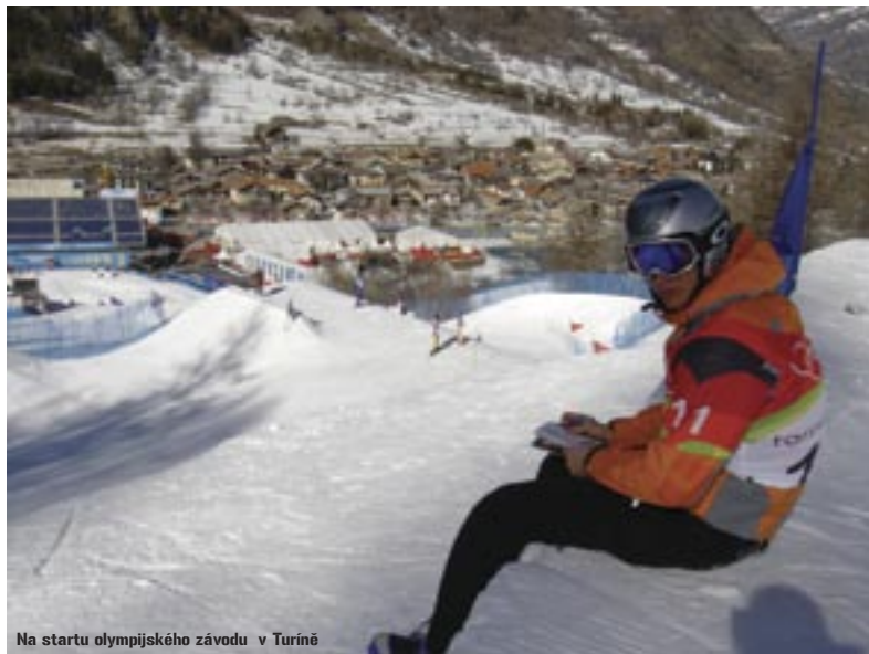
Na startu olympijského závodu v Turíně